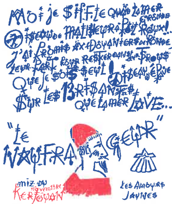
« Le naufrageur » de Jacques Villeglé Notre première acquisition qui s'inscrit dans « Signe et écriture »

L'association s'est aussi rapprochée de certaines écoles d'art de la région pour découvrir les œuvres d'artistes émergents.