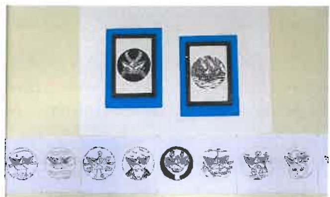
Réalisations à partir de 2 oeuvres de Antoine Le Bihan