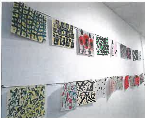
Travail réalisé à partir de "Images invisibles" de Guillaume Goutal

.... et peuvent devenir à leur tour des médiateurs en organisant des visites pour les autres classes, les adultes de l'école, les familles.